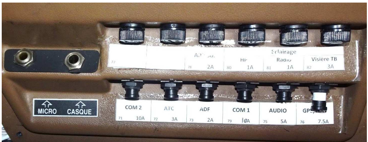
Détail du panneau porte-fusibles droit (N° 25)