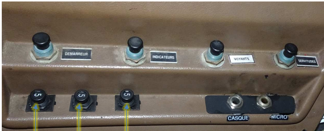
Détail du panneau porte-fusibles gauche (N° 45)